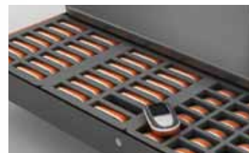
Förvaringslådan kan låsas för ökad säkerhet