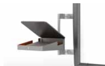
Hyllan med låsbart fack (tillval) rymmer en bärbar dator på upp till 17 tum